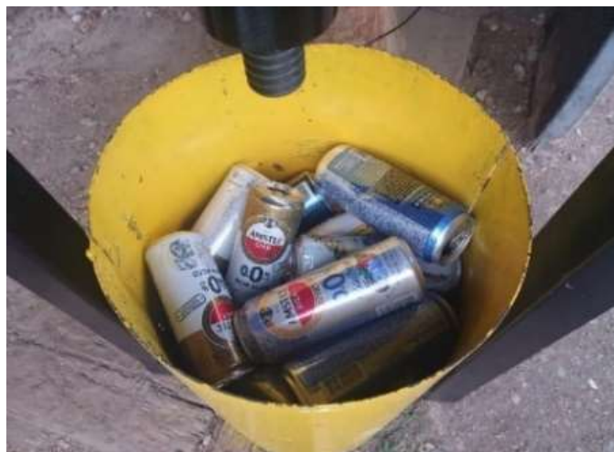
Рис. 1. Металлические отходы в камере уплотнения

емкостью 0,5 литра, а также жестяными банками из-под консервов, что отображено на рис. 1.