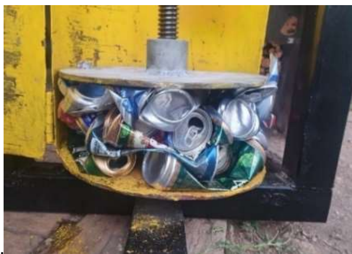
Рис. 2. Уплотнение металлических отходов при поступательно-вращательном движении

В ходе испытаний осуществлялось уплотнение металлических отходов. На рисунке 2 представлены результаты этого процесса, а именно отходы, спрессованные плитой, совершающей комбинированное поступательно-вращательное движение.